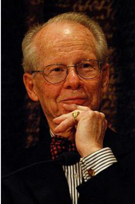
Оливер Уильямсон 1932 -

Уильямсон выделяет три наиболее значимых, по его мнению, параметра трансакции: