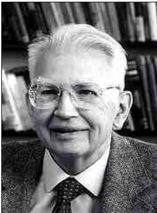
Рональд Коуз (1910-2013)

С точки зрения Коуза, функционирование рыночного механизма не свободно от издержек поиска партнеров, сбора информации, составления контракта, пересмотра контракта в связи с изменением обстоятельств и многих других. Большая часть всех этих издержек обусловлена, по словам Коуза, подбором «соответствующих» цен. Издержки порождаются, прежде всего, асимметрией информации между участниками, которая препятствует эффективной работе механизма спроса-предложения, регулирующего рыночные цены. Именно наличие издержек функционирования рыночного механизма, объясняет феномен возникновения фирмы : фирмы образуются потому, что перевод транзакции с рынка в рамки фирмы позволяет избежать издержек, свойственных рынку.